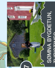
7 SØMNA BYGDETUN, TURISTINFO