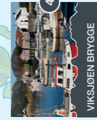
4 VIKSJØEN BRYGGE