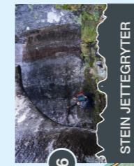
6 STEIN JETTEGRYTER